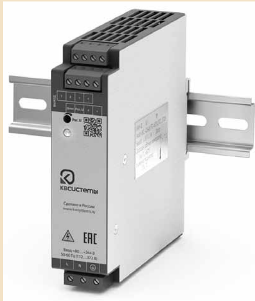
Рис. 1. КАН-Д50

Силовая часть КАН-Д50 построена по квазирезонансной схемотехнике с синхронным выпрямле-